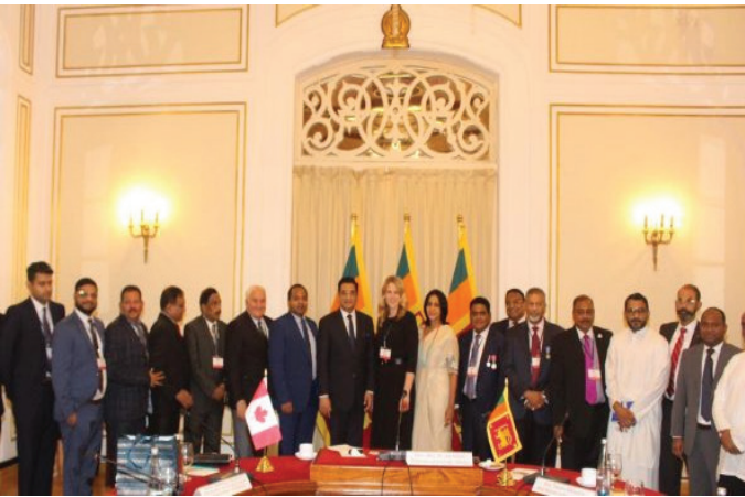
இலங்கை பாரம்பரிய உயர்மட்டவர்த்தக தூதுக்குழு கனடாவிலிருந்து இலங்கைக்கு விஜயம்