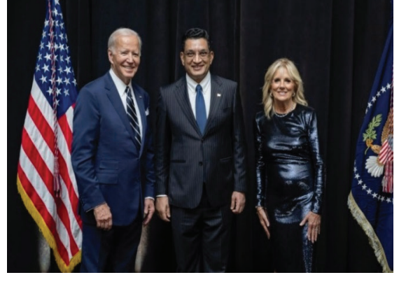
நியூயோர்க்கில் ஐக்கிய நாடுகள்பொதுச் சபைக் கூட்டத்தின் போது சர்வதேச பிரமுகர்களை வெளிநாட்டு அலுவலர்கள் அமைச்சர் அலி சப்ரி அவர்கள் சந்தித்தமை