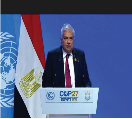
எகிப்தில் CoP-27மாநாட்டில் சனாதிபதி ரணில் விக்கிரமசிங்க பங்கேற்றமை