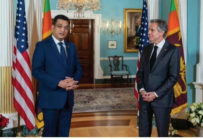
அமெரிக்க வெளிவிவகார அமைச்சர் ஆண்டனிபிளிங்கன் அவர்களை வெளிநாட்டு அலுவலர்கள் அமைச்சர் அலி சப்ரிசந்தித்தமை