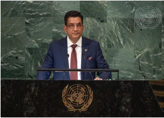
2022 செப்டெம்பர் 24 ஆம் திகதி ஐக்கிய நாடுகள்பொதுச் சபையின் 77 ஆவது கூட்டத்தொடரின் பொது விவாதத்தில் வெளிநாட்டு அலுவல்கள் அமைச்சர் அலி சப்ரி வெளியிட்ட அறிக்கையிடல்