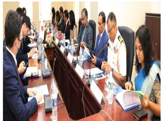
2022 யூலை 15 ஆம் திகதி நடைபெற்ற யப்பான்- இலங்கை முன்றாவது கொள்கை கலந்துரையாடல் கூட்டம்