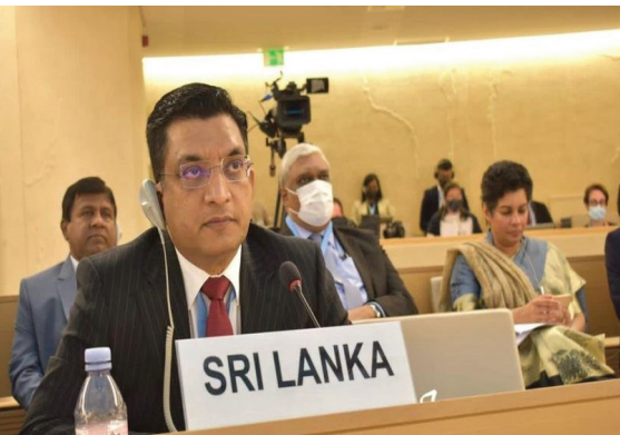
ஐக்கிய நாடுகள் மனித உரிமைகள் பேரவையின் 51 ஆவது அமர்வில் வெளிநாட்டு அலுவல்கள் அமைச்சர் அலி சப்ரி அவர்கள் அறிக்கையிடல்