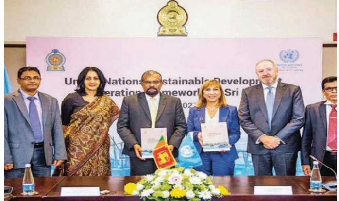
இலங்கைக்கான 2023-2027 காலப்பகுதிக்கான இலங்கையின் ஐக்கிய நாடுகள் நிலைபேறான அபிவிருத்தி ஒத்துழைப்பு கட்டுக்கோப்பு (UNSDCF)