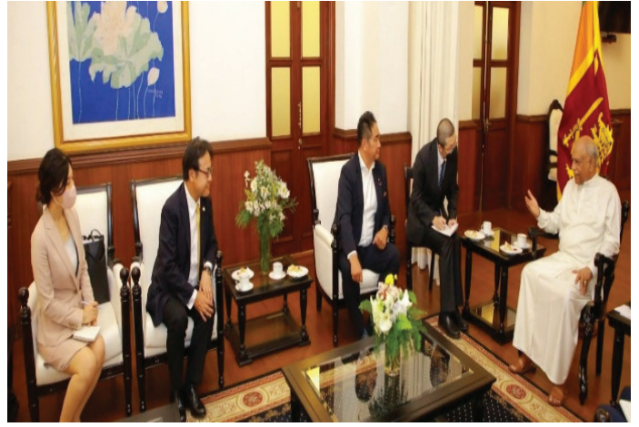
இலங்கைக்கு உதவுவதற்கான உண்மை கண்டறியும் குழுவில் சிரேஷ்ட யப்பான் பாராளுமன்ற உறுப்பினர்