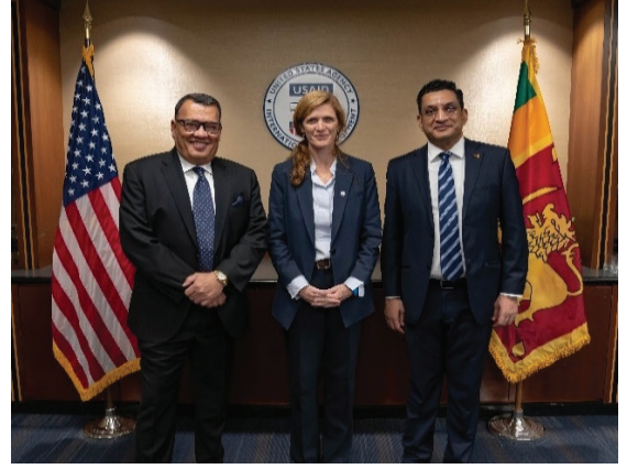
USAID இலங்கை நிருவாகியை வெளிநாட்டு அலுவலர்கள் அமைச்சர் சந்தித்தமை