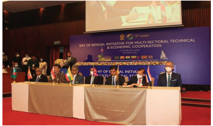
2022 மார்ச் 20 அன்று கொழும்பில் நடைபெற்ற 5ஆவது BIMSTEC உச்சிமாநாட்டில் உறுப்பு நாடுகளின் உயர்மட்ட பிரமுகர்கள் கலந்து கொண்டமை